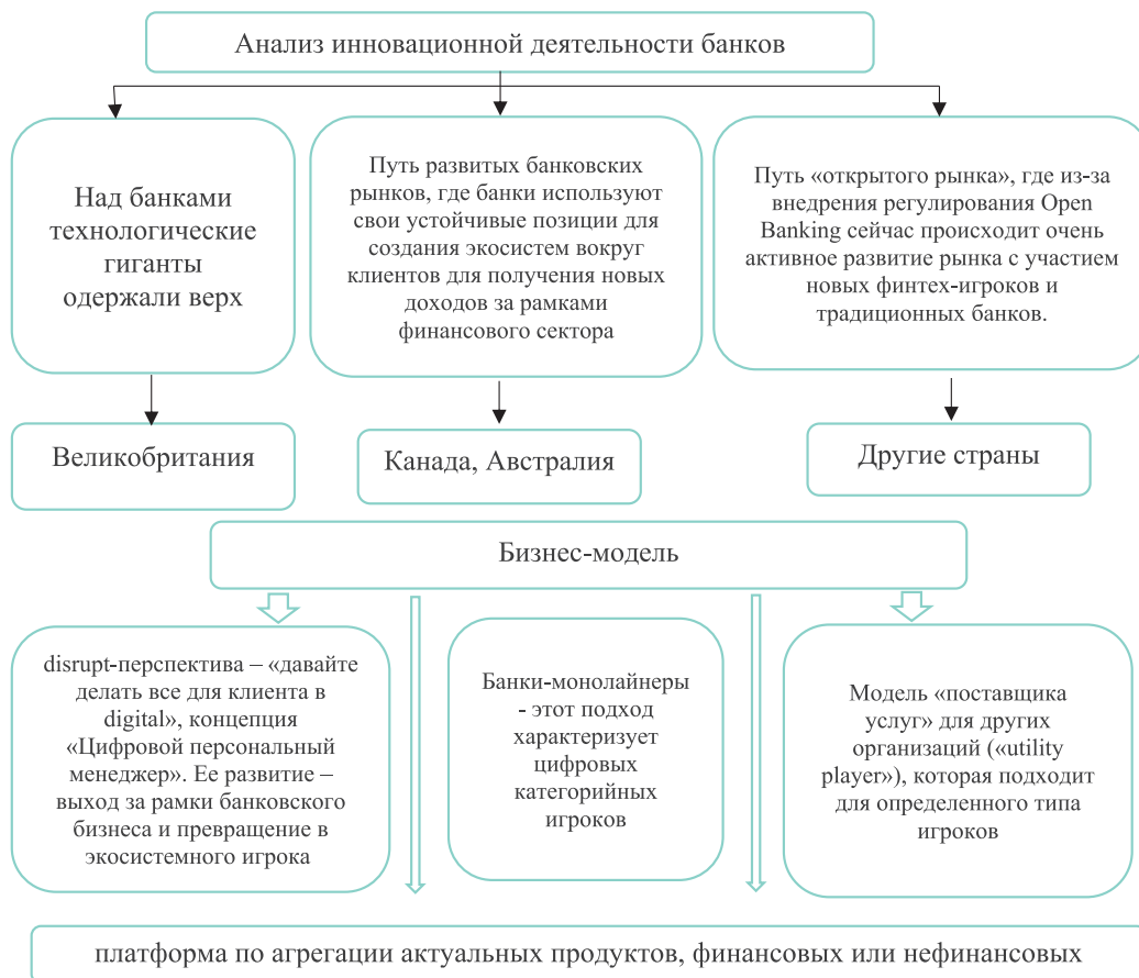
Рисунок 1. Инновационные аспекты БВУ в совершенствовании механизма управления проблемными кредитами