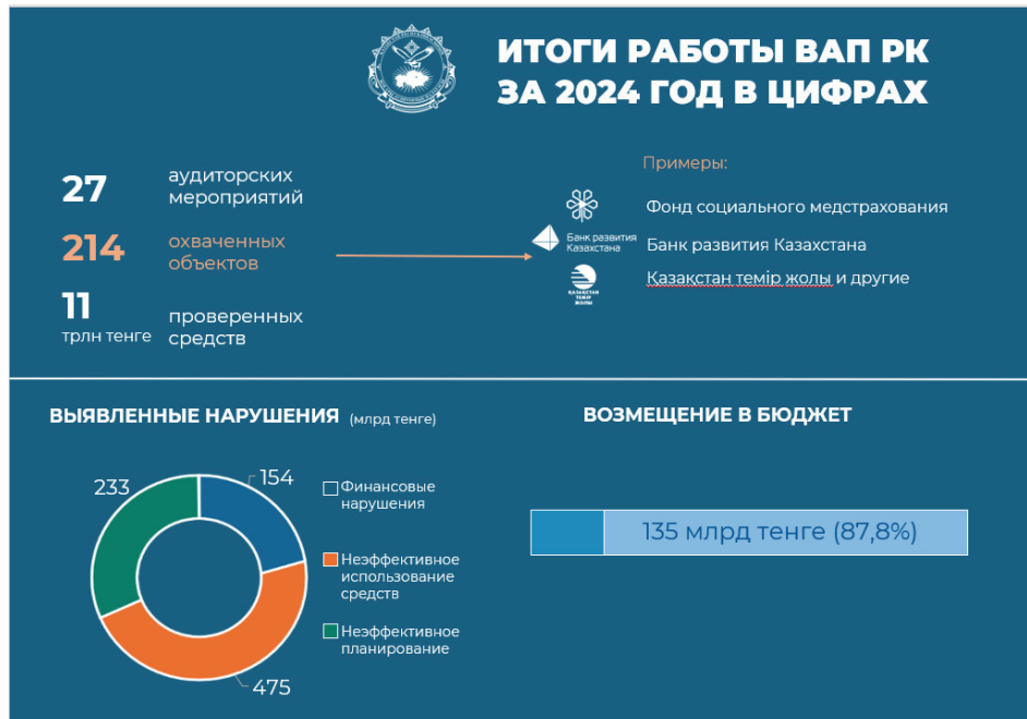
Рисунок 2 – Итоги работы Высшей аудиторской палаты Республики Казахстан за 2024 год Примечание: составлено автором на основе источника [5]

В результате анализа финансовой отчетности и прочих документов, изучения рабочих процессов и содержания практических кейсов объектов аудита государственные аудиторы выявили нарушения на общую сумму 862 млрд тенге. В их числе: финансовые – на 154 млрд тенге, неэффективное использование средств и активов государства – на 475 млрд тенге, неэффективное планирование – почти на 233 млрд тенге. В общей сложности в государственный бюджет возмещено более 135 млрд тенге, что в пять раз больше суммы возмещения в 2023 году и составляет 87,8% от общего объема средств, подлежащих восстановлению (Рисунок 2).