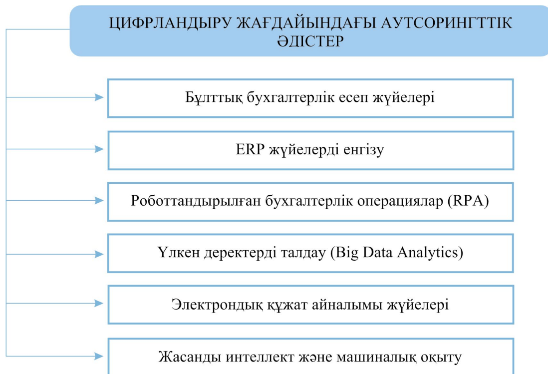
1-сурет. Цифрландыру жағдайындағы аутсорингтік әдістер

Ескерту: суретте көрсетілген деректер автор тарапынан Кенyon, А., et al. еңбегі негізінде құрастырылған (Кенyon et al., 2016, p. 34)