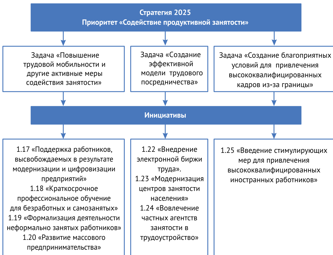
Рисунок 3. Приоритет «Содействие продуктивной занятости» в Стратегическом плане развития Республики Казахстан до 2025 года

В ГПИИР 2015-2019 гг. отмечается, что «под диверсификацией понимается обеспечение большей устойчивости экономики путем снижения влияния горнодобывающего сектора через стимулирование секторов, наименее зависящих от волатильности на сырьевых рынках и других неконтролируемых факторов. К таким секторам отнесены обрабатывающий сектор и сектора продуктивных услуг. Продуктивные услуги – услуги, связанные с созданием реальной экономической ценности, а не с перераспределением добавленной стоимости (финансовые, торговые, посреднические услуги). К продуктивным можно отнести инжиниринг и сервис, транспортные, инфокоммуникационные, космические, социальные услуги в области образования и здравоохранения, исследования, сферу обслуживания и быта, туризм и т.п.».